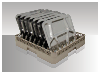
01 Gaveta com capacidade para 18 pratos ou 9 bandejas. (Ref.: GP)